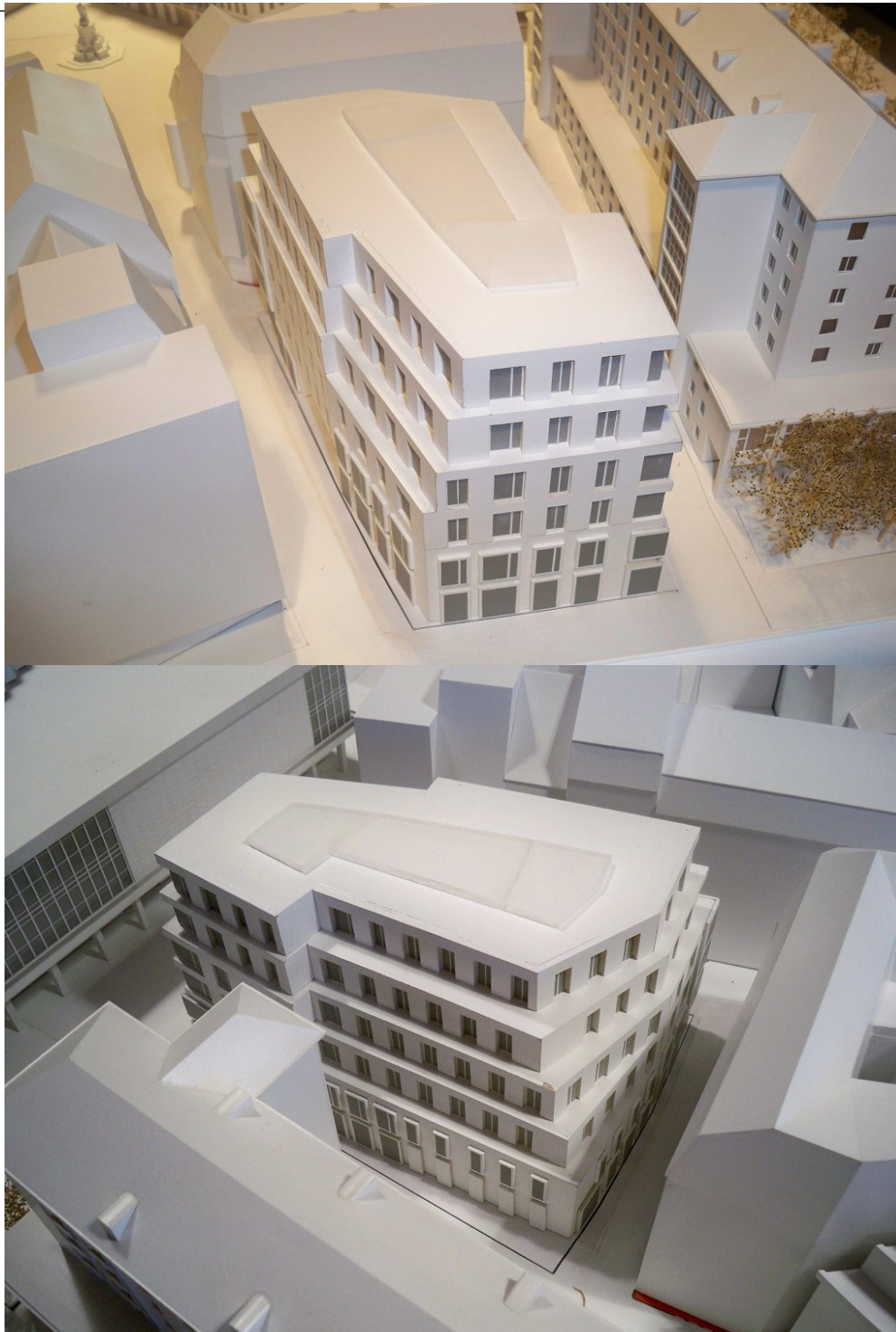
1.Preis des Wettbewerbsverfahrens Quartier V-1: F29 Architekten