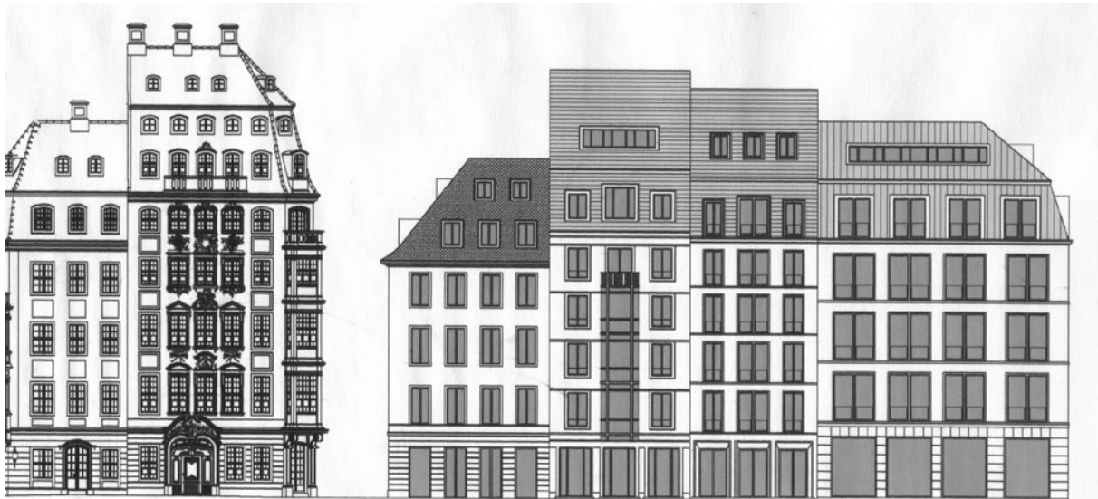
markt 12 / Frauenstraße 14