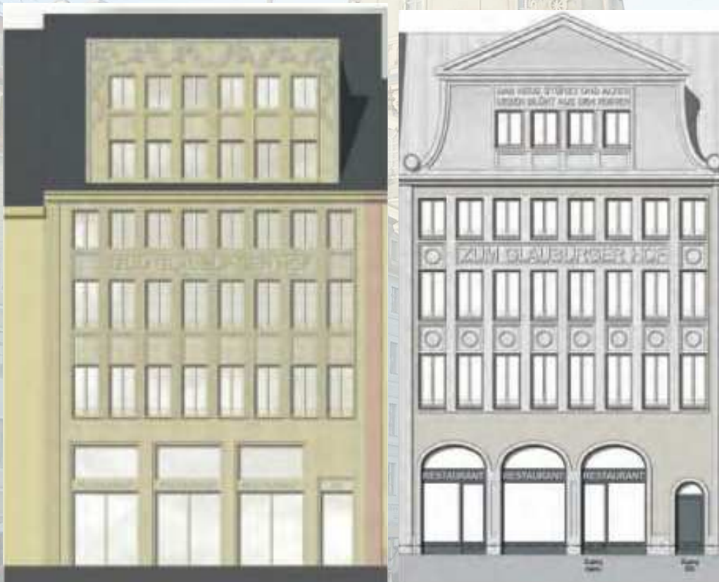
Braubachstraße 29, vor und nach der Planüberarbeitung