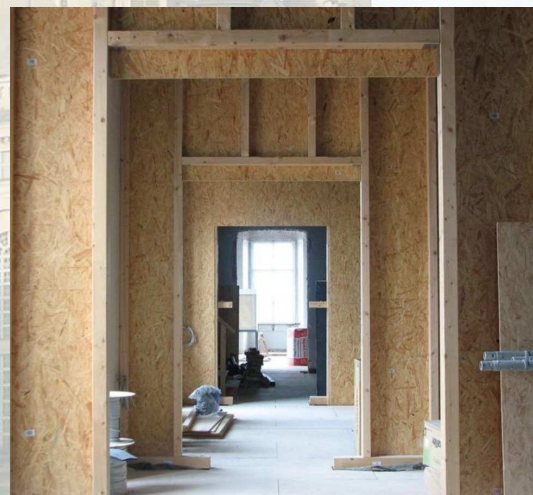
Bruchsaler Paraderäume vor und während der Wiederherstellung