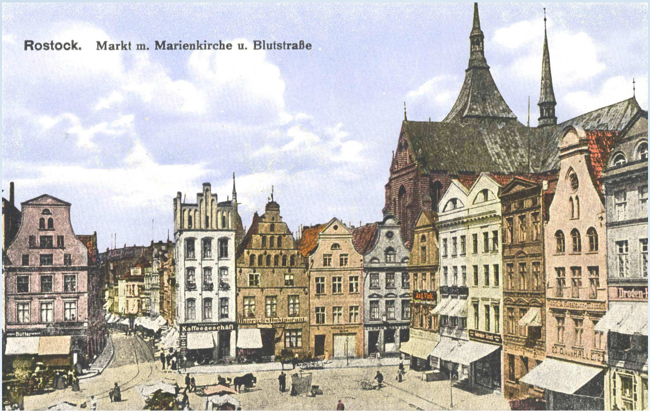
Rostock. Markt m. Marienkirche u. Blutstraße