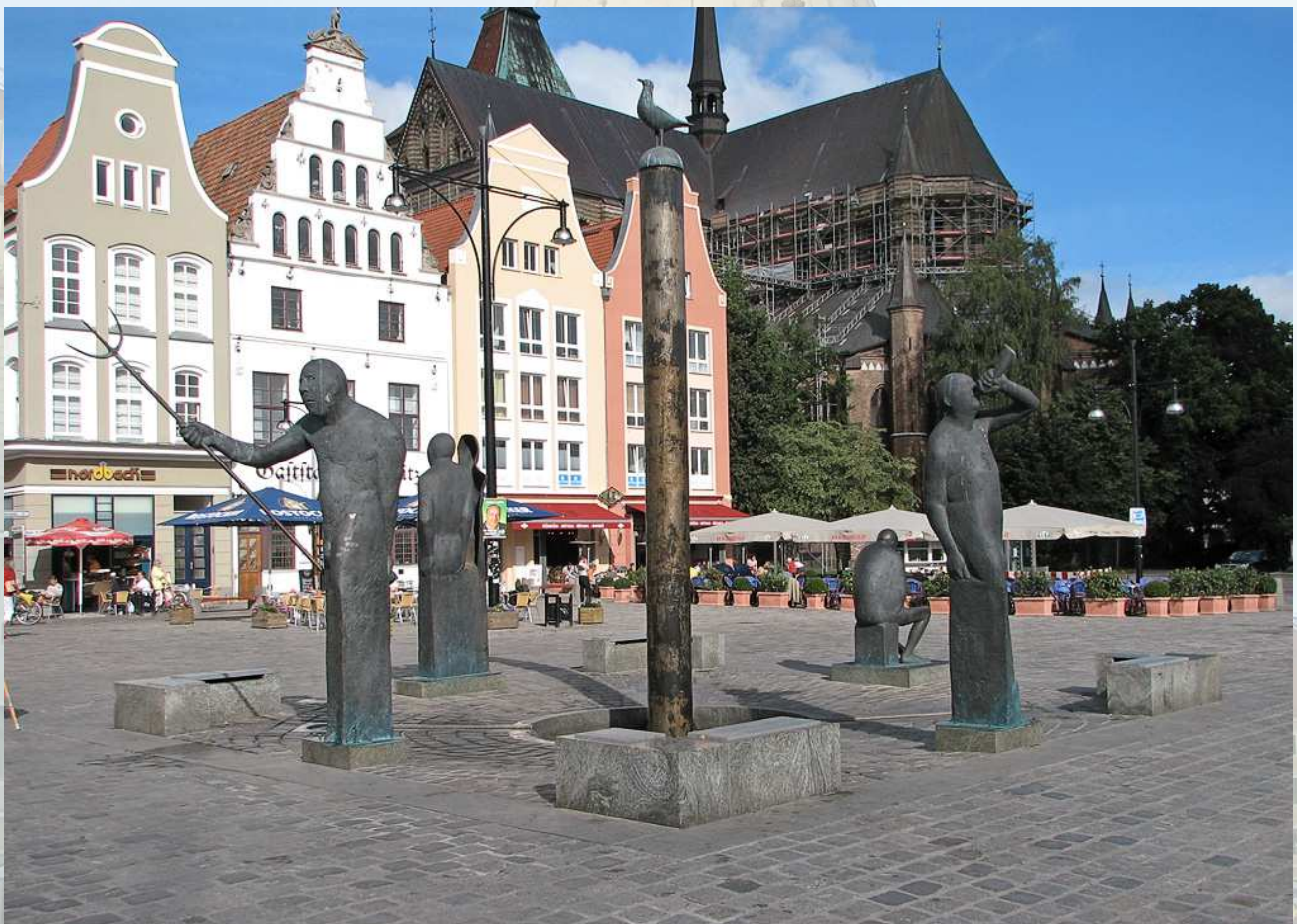
Rostock, Neuer Markt vor 1942 (oben) und heute (unten)