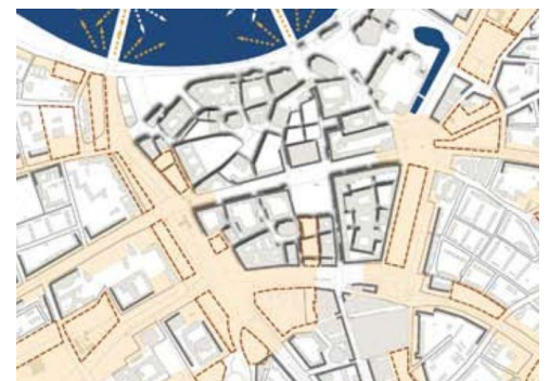
Planungsleitbild Innenstadt 2008 mit gestrichelt eingezeichneten Entwicklungsflächen

Das Planungsleitbild Innenstadt von 2008 sieht eine Verdichtung der Innenstadt vor. Ausdrücklich wird Kleinteiligkeit als „angemessene Antwort auf die Frage nach der zukünftigen Stadtgestalt Dresdens“ genannt, so ermögliche „Parzellenstädtebau [...] auch kleinere private Investitionen und erschließt neue Wohnqualitäten, Preisstrukturen und neue Märkte“.