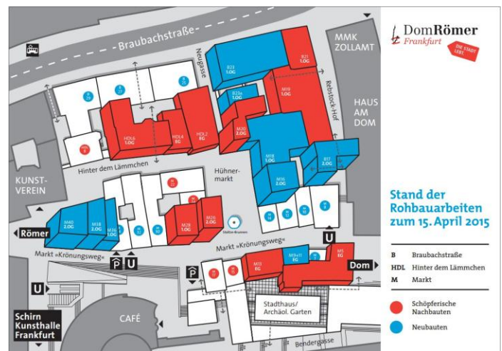
Aktueller Stand der Rohbauarbeiten