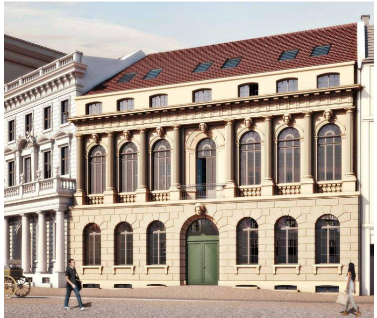
Visualisierung Palazzo Pompei