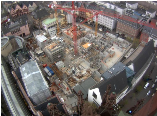
Blick vom Dom auf das Dom-Römer-Areal, Stand 17.4.2015

Weiterführender Link: http://www.domroemer.de