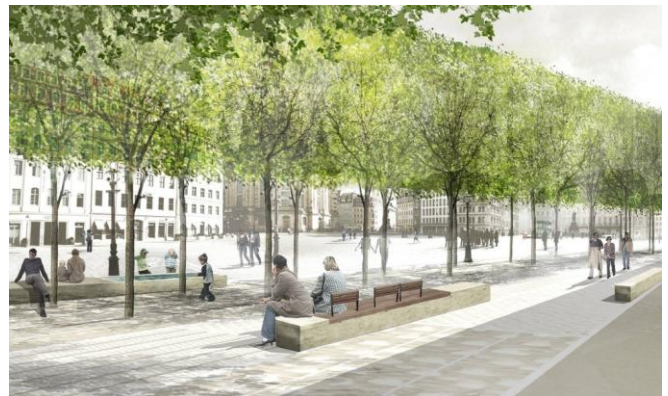
Geplante Gestaltung des Gewandhausareals