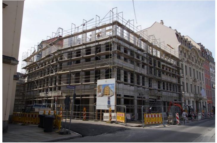
Blick in die Landhausstraße Ecke Friesengasse. Der Bau des „Frieseneck“ geht zügig voran. Die Fassaden werden in Kalksandstein ausgeführt. Außer der Fassade links neben dem British Hotel werden die Häuser in moderner Formensprache errichtet. Mehr zum Frieseneck im Newsletter 3/2015.

Rasant schreiten die beiden Bauprojekte am Jüdenhof (Kimmerle Unternehmen) und an der Landhausstraße (MMZ Real Estate GmbH) voran. Während zwischen Sporergasse, Schössergasse, Rosmaringässchen und Jüdenhof die ersten Erdgeschosszonen sichtbar sind und die Keller des Dinglingerhauses noch frei liegen, ist das „Frieseneck“ in der Landhausstraße bereits im dritten Obergeschoss angelangt. Für das Kimmerle-Projekt ist die Fertigstellung für das dritte Quartal 2016 anvisiert. MMZ möchte bereits diesen August fertig werden.