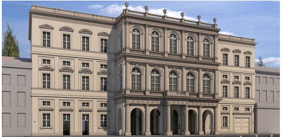
Visualisierung Palast Barberini, Fassade zum Alten Markt

Zusammen mit dem Palast Barberini befinden sich zwei benachbarte historische Bauwerke zwischen Havelufer und dem rekonstruierten Stadtschloss im Wiederaufbau: die direkt südlich anschließenden Palazzi Chiericati und