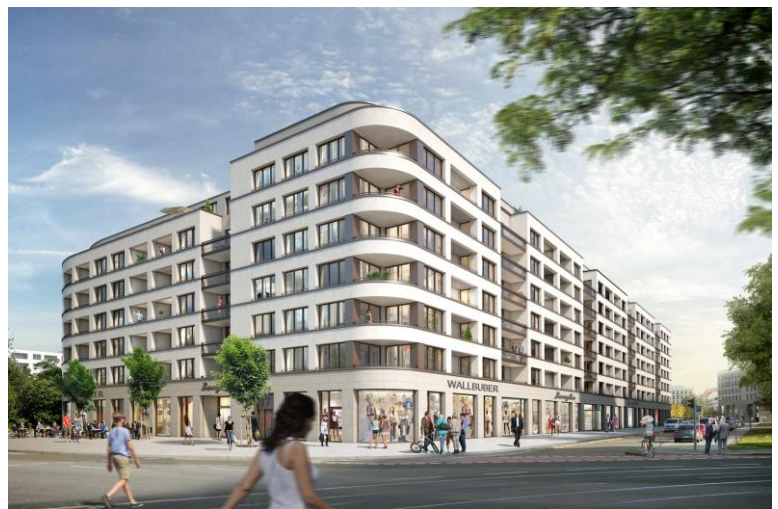
Visualisierung und Entwurf: MPP – Meding Plan + Projekt GmbH (© Revitalis AG)

Das Hamburger Immobilienunternehmen Revitalis AG steht offenbar kurz vor der Unterzeichnung eines Kaufvertrags mit der Stadt. Auf dem 4.572 qm großen Baufeld „MK 2“ zwischen Schweriner Straße und Hertha-Lindner-Straße soll für 25 Mio Euro ein Wohn- und Geschäftshaus mit 156 Wohneinheiten entstehen. Das Hamburger Büro MPP – Meding Plan + Projekt GmbH ging als Sieger aus einem Fassadenwettbewerb hervor. Die abgerundeten Ecken des Entwurfes nehmen Bezug auf das 1923