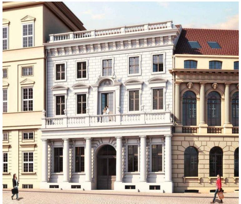
Visualisierung Palazzo Chiericati (© RIVA VISTA GmbH & Co. KG)