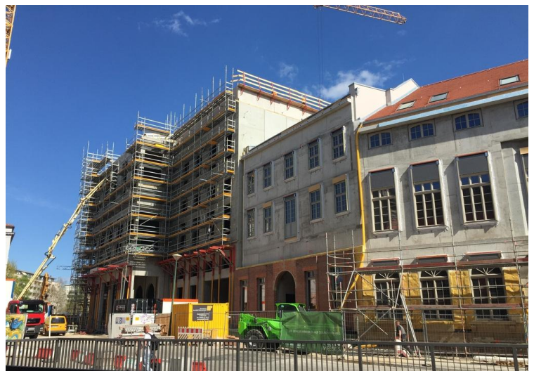
Aktuelle Bausituation