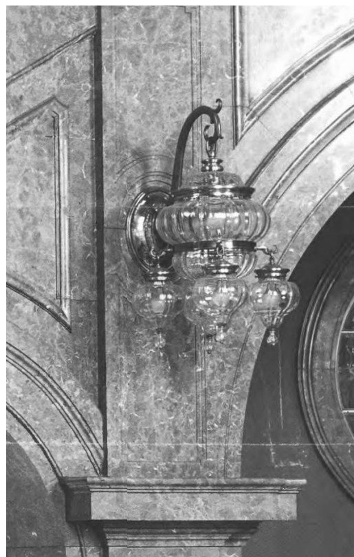
Historische Leuchte im Dresdner Rathaus um 1935

Wie stilisierte Blüten waren die aus Kristallglas und Bronze gefertigten feingliedrig wirkenden Leuchtkörper gestaltet. Sie bestanden aus gläsernen Schalen, abgeflachten Kugeln und Halbkugeln, zwischen denen sich bronzene Ringe befanden. Als wichtiger Bestandteil der Ausstattung des Treppenhauses fügten sie sich in eine außergewöhnliche Konzeption ein. Im Sinne eines Gesamtkunstwerkes entwarf der Dresdner Akademieprofessor Otto Gussmann die noch heute komplett erhaltene Monumentalmalerei des Raumes. In enger Zusammenarbeit mit den Rathaus-Architekten Karl Roth und Edmund Bräter zielte er auf ein Zusammenwirken aller beteiligten Künste zu einer erhebenden Gesamtwirkung. Gussmann vertrat Reformideen, die damals europaweit auf eine Erneuerung der Monumentalkunst als Raumkunst zielten. Die Ausmalung des Treppenhauses appelliert an die Ratsherren, sich für das Gemeinwohl einzusetzen. Dafür personifizieren Figuren in der Kuppel Ideen wie Arbeit, Kunst, Frieden und Rechtspflege. Gussmann war außerdem der Lehrer der Maler Otto Dix und Max Pechstein.