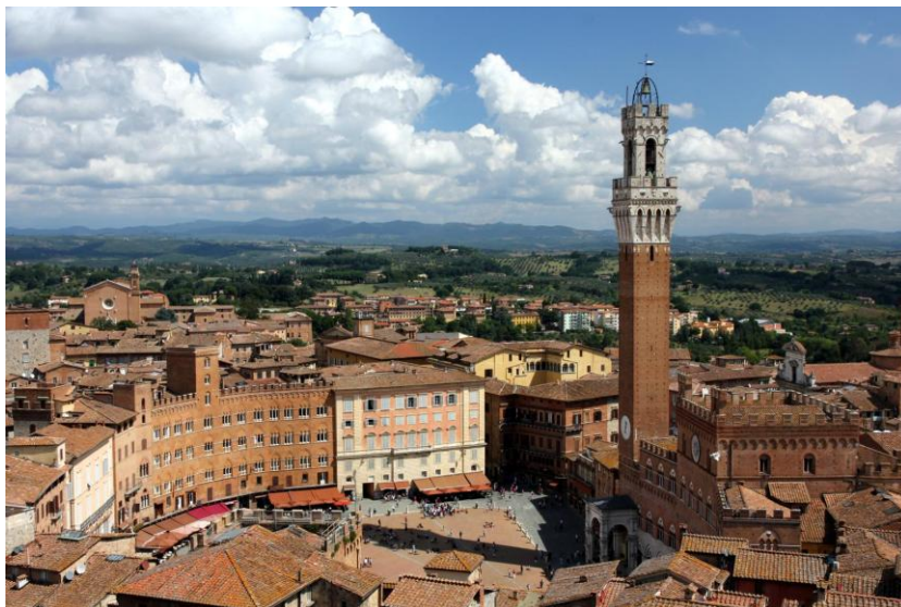
Die Piazza del Campo in Siena vom Turm der Kathedrale

Wie kaum ein anderer europäischer Platz verkörpert die Piazza del Campo im italienischen Siena bürgerschaftliches Selbstbewusstsein. Schon im 12. Jahrhundert erlangte die Stadt politische Autonomie und somit auch eine autonome Rechtsprechung und Verwaltung. Auf der südöstlichen Seite des Platzes erbaute sich die Bürgerschaft unter der „Herrschaft der Neun“ aus einer ehemaligen Festung den Palazzo Pubblico, das Rathaus der Stadt. Zwischen 1325 und 1348 erhielt er seinen 102 Meter hohen