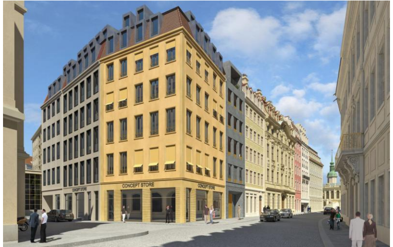
Visualisierung des „Friesenecks“