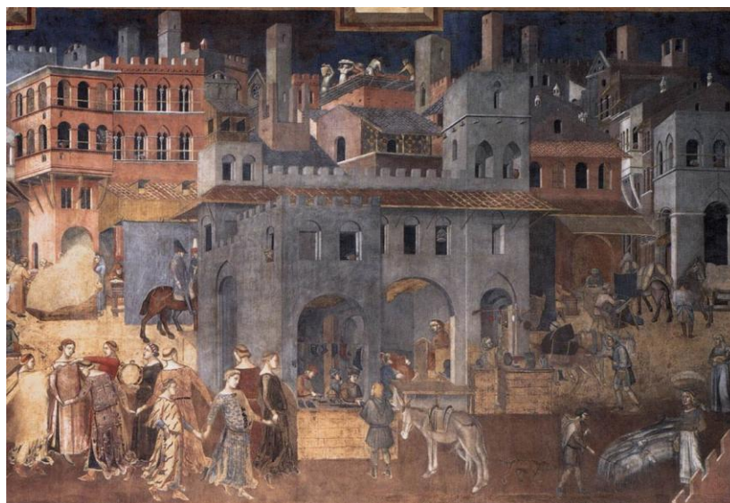
Ambrogio Lorenzetti: Auswirkungen der guten Regierung auf die Stadt (1338-40), im „Raum des Friedens“ des Palazzo Pubblico

Prägten bis in die Frühe Neuzeit noch die vielen „Geschlechtertürme“ das Stadtbild, wie sie in den Fresken Lorenzettis zu sehen sind, wurden diese in der Barockzeit fast alle abgerissen. Während des 19. Jahrhunderts versetzte man viele der Häuser an der Piazza del Campo in den Zustand der Gotik zurück.