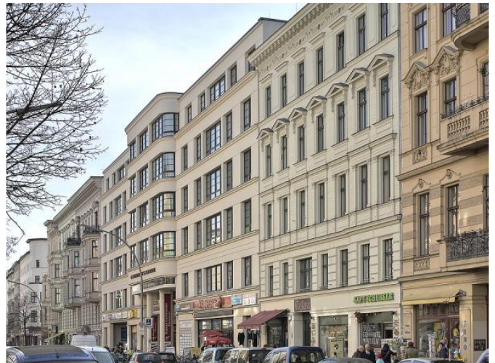
Kreuzberger Gesundheitszentrum

Der Architekt Tobias Nöfer hat sich jüngst im Deutschen Architektenblatt für ein angepasstes Bauen im städtebaulichen Kontext ausgesprochen. Er plädiert für die Überwindung des Zwangs heutiger Architekten, zugleich konventionell- und avantgardistisch-modern bauen zu wollen. Denn diesen Zwang sehe man den Gebäuden schmerzhaft an. Besonders den dogmatisch begründeten Verzicht auf Schrägdächer oder Traufüberstände, die im mitteleuropäischen Klima eine zutiefst praktische Funktion hätten, kritisiert der Architekt. „Asymmetrisch platzierte, mehr oder minder frei