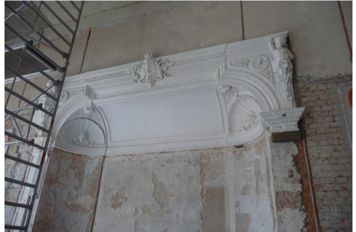
Wandnische des Kleinen Ballsaals, Zustand August 2011

Für das Jahr 2015 hat der Bund sechs Millionen Euro für den Wiederaufbau des Dresdner Residenzschlosses bereitgestellt. Das Geld soll unter anderem für die Rekonstruktion des Kleinen Ballsaals verwendet werden. Der prunkvolle Raum im Stil des Historismus wurde zwischen 1866 und 1868 im Zuge der klassizistischen Umgestaltung des Georgentors vom Semper-Schüler Bernhard Krüger gestaltet. Aufgrund der Finanzausgaben steht nun genug Geld bereit, um den Kleinen Ballsaal bis Ende 2016 fertigzustellen. Geplant sind Kosten