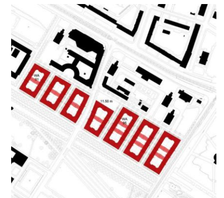
Projekt „Blüherpark“ (Christoph Mäckler Architekten)