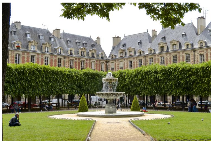
Die Place des Vosges heute.