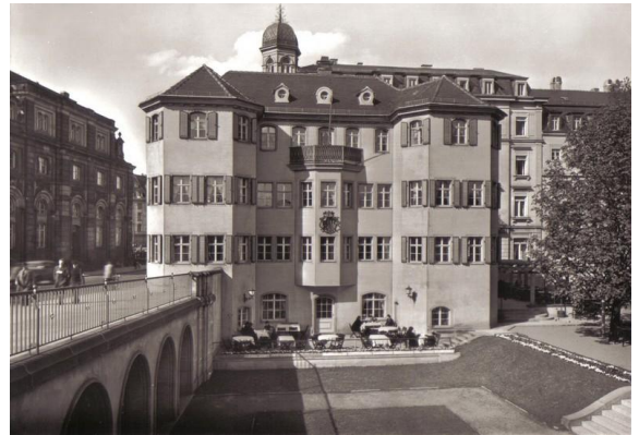
Das „Narrenhäusel“ am nördlichen Brückenkopf der Augustusbrücke