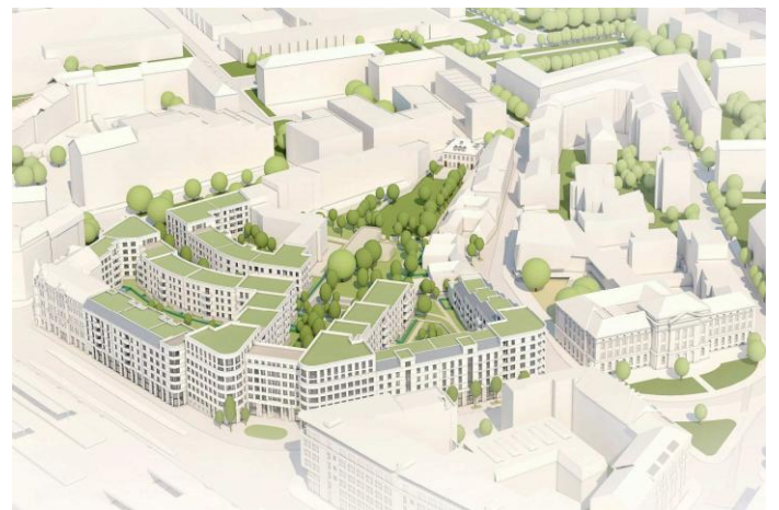
Projekt „KÖ25“ zwischen Könneritzstraße und Schützenplatz (Visualisierung: Nöfer Gesellschaft von Architekten mbH)