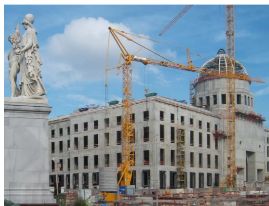
Rohbau des Berliner Stadtschlusses mit Richtkranz auf der Kuppel.

Das Berliner Stadtschloss wurde 1950 gesprengt, um Platz zu schaffen für ein Aufmarschgelände mit Tribüne. 1976 wurde der „Palast der Republik“ fertiggestellt, der den Sitz der Volkskammer bildete, sowie diverse Veranstaltungsräume, Galerien und gastronomische Einrichtungen beherbergte. Das mit 5000 Tonnen Spritzasbest verseuchte Bauwerk wurde bereits 1990 geschlossen und nach mehreren Zwischennutzungen bis 2006 abgerissen.