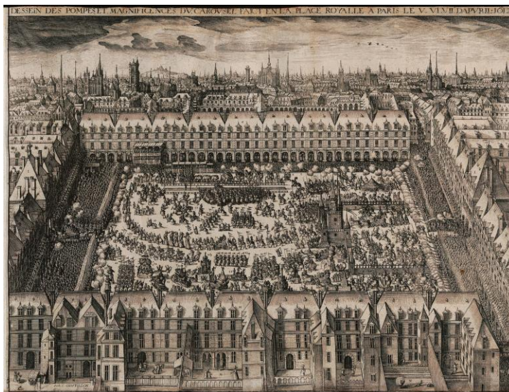
Claude Chastillon: Festlichkeiten zur Einweihung der Place Royale (heute Place des Vosges), 5.–7. April 1612, anlässlich der Doppelhochzeit von König Ludwig XIII. mit Anna von Österreich (1601–1666) und der Schwester des Königs, Elisabeth, mit dem künftigen König Philipp IV. von Spanien (CC-BY-SA 3.0)

Die von Claude Chastillon und Louis Métezeau entworfenen insgesamt 35 dreigeschossigen Stadtpalais besitzen in den Erdgeschossen durchlaufende Arkaden – das früheste Beispiel dieser Art in Frankreich und späteres Vorbild für ganz Europa. Sämtliche Fassaden folgen dem Muster des als südliches Tor dienenden „Pavillon du Roi“. Auch Richelieu bewohnte eines der Häuser: die Nr. 21. Er ließ 1639 eine Reiterstatue Ludwigs XIII. in der Mitte des Platzes errichten. Ursprünglich nannte sich der Platz „Place Royale“, wurde jedoch während der Revolution umbenannt und des Reiterstandbildes beraubt. Erst 1866 legte man den geometrischen Garten auf der Platzfläche an.