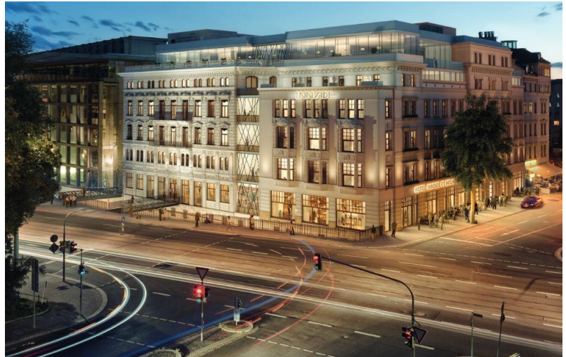
Visualisierung des in Bau befindlichen Hotels der Kette Sol Meliá. Die linke Fassade wird originalgetreu rekonstruiert.