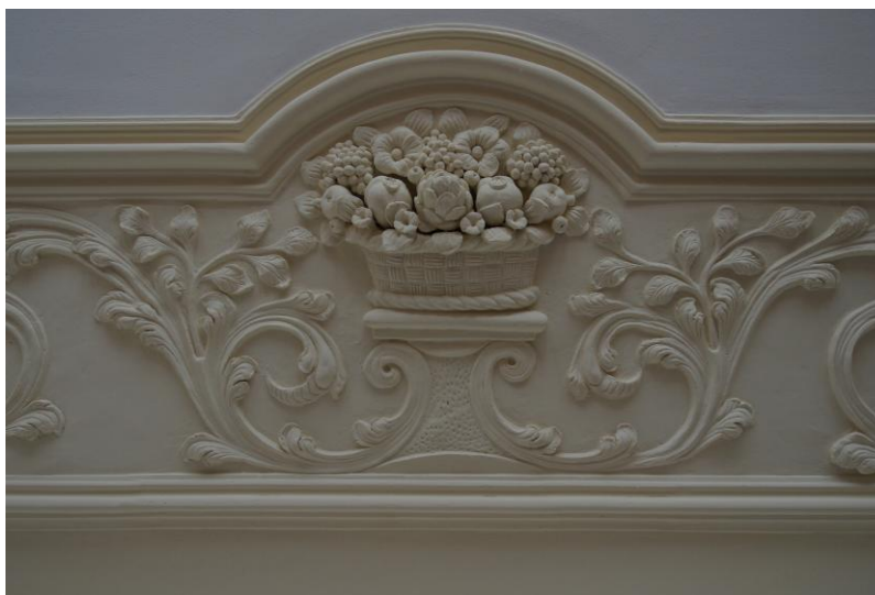
Historische Stuckdecke im Erdgeschoss (Detail)