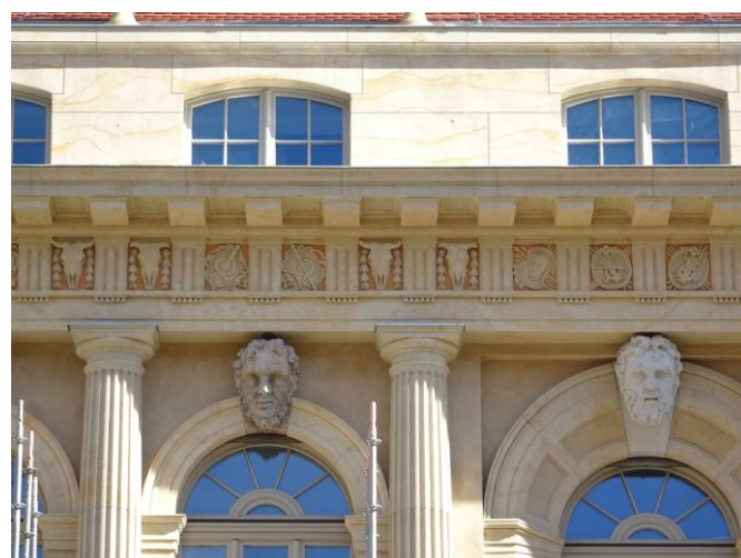
Palazzo Chiericati (links) und Palazzo Pompei (rechts) in Potsdam

Am Potsdamer Alten Markt lassen sich seit kurzem zwei weitere Fassaden bewundern. Die Rekonstruktionen der Palazzi Chiericati und Pompei, die von der zweiten Hälfte des 18. Jahrhunderts bis ins Jahr 1945 die Südseite des Platzes prägten, wurden schon damals als Nachschöpfungen errichtet. Ersterer paraphrasiert den aus dem 16. Jahrhundert stammenden gleichnamigen Bau des Architekten Palladio in Vicenza, während letzterer sich an einem Bau des 16. Jahrhunderts in Verona orientiert. Der Wiederaufbau beider Leitbauten wurde initiiert von der Prinz von Preußen Grundbesitz AG, die in dem als „Stadtschloss Ensemble“ firmierenden Projekt Raum für 23 Wohnungen und vier Läden schaffen will.